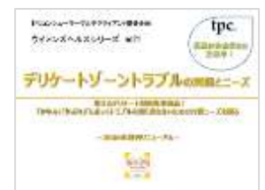
デリケートゾーン(8月発刊予定)