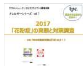
花粉症 2017(6月末発刊予定)