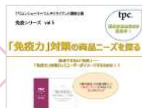
免疫力(5月24日発刊予定)