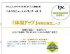
体温アップ(5月末発刊予定)