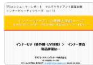
インナーUV(8月発刊予定)